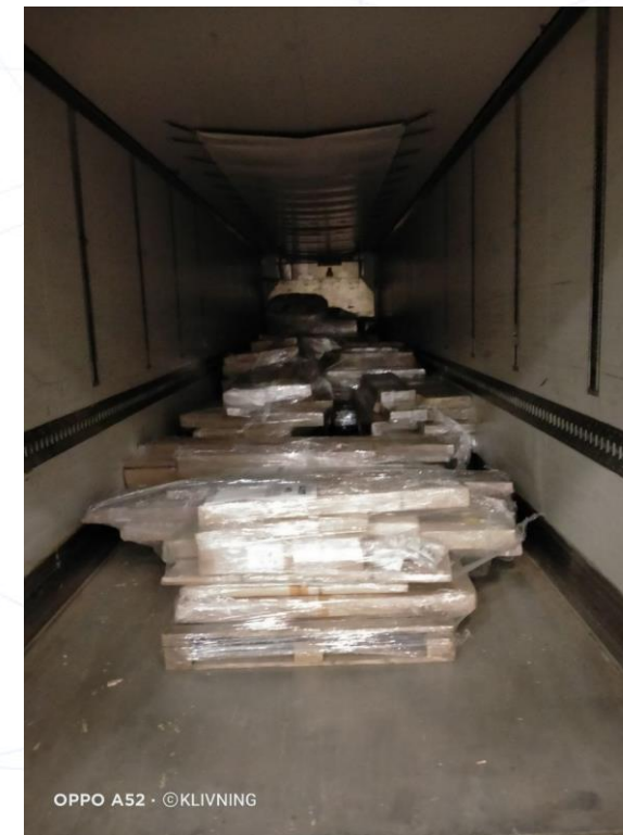
Фото с погрузки на складах